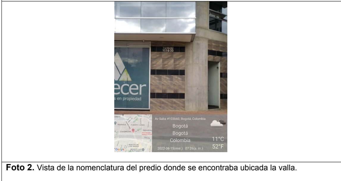
Foto 2. Vista de la nomenclatura del predio donde se encontraba ubicada la valla.